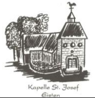
Kapelle St. Josef Eisten