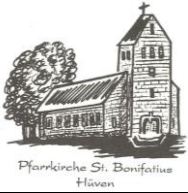
Pfarrkirche St. Bonifatius Hüven